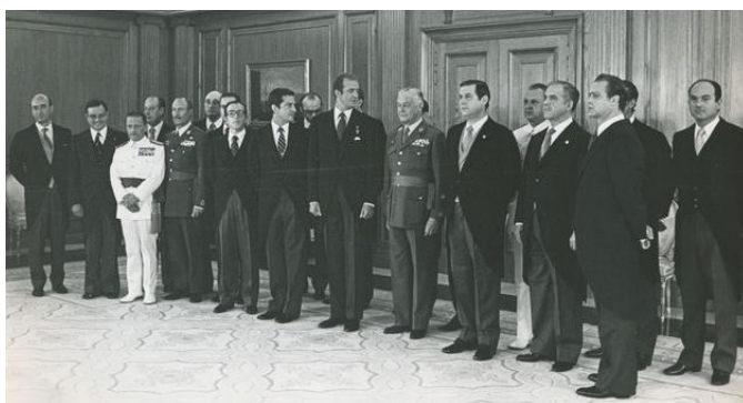
Jura del Primer Gobierno de Adolfo Suárez. Palacio de la Zarzuela, 8 de julio de 1976.

Relacione esta imagen con el papel del rey y el gobierno de Adolfo Suárez en la Transición Democrática.